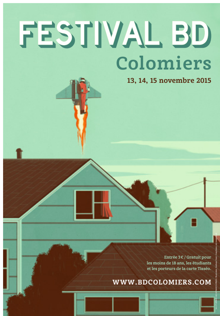
Affiche réalisée par Emiliano Ponzi.