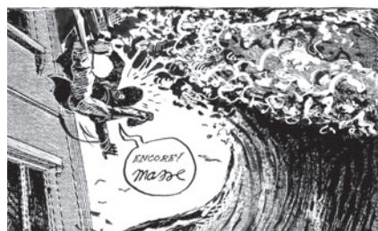
Encore Masse © Francis Masse.