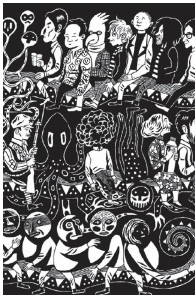
Portraits de mon frère et du roi du monde © David B.