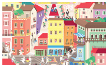
Mégapole. © L'Agume - Cléa Dieudonné.

Les visuels en haute définition sont disponibles sur simple demande par e-mail à helene.picot@mairie-colomiers.fr