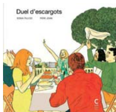
Pulido © Cambourakis

Comme chaque année, au lendemain du festival d'Angoulême, la Bpi vous propose de rencontrer des dessinateurs étrangers venus présenter leur travail au public parisien. Cette année nous avons le plaisir de recevoir trois auteurs espagnols.